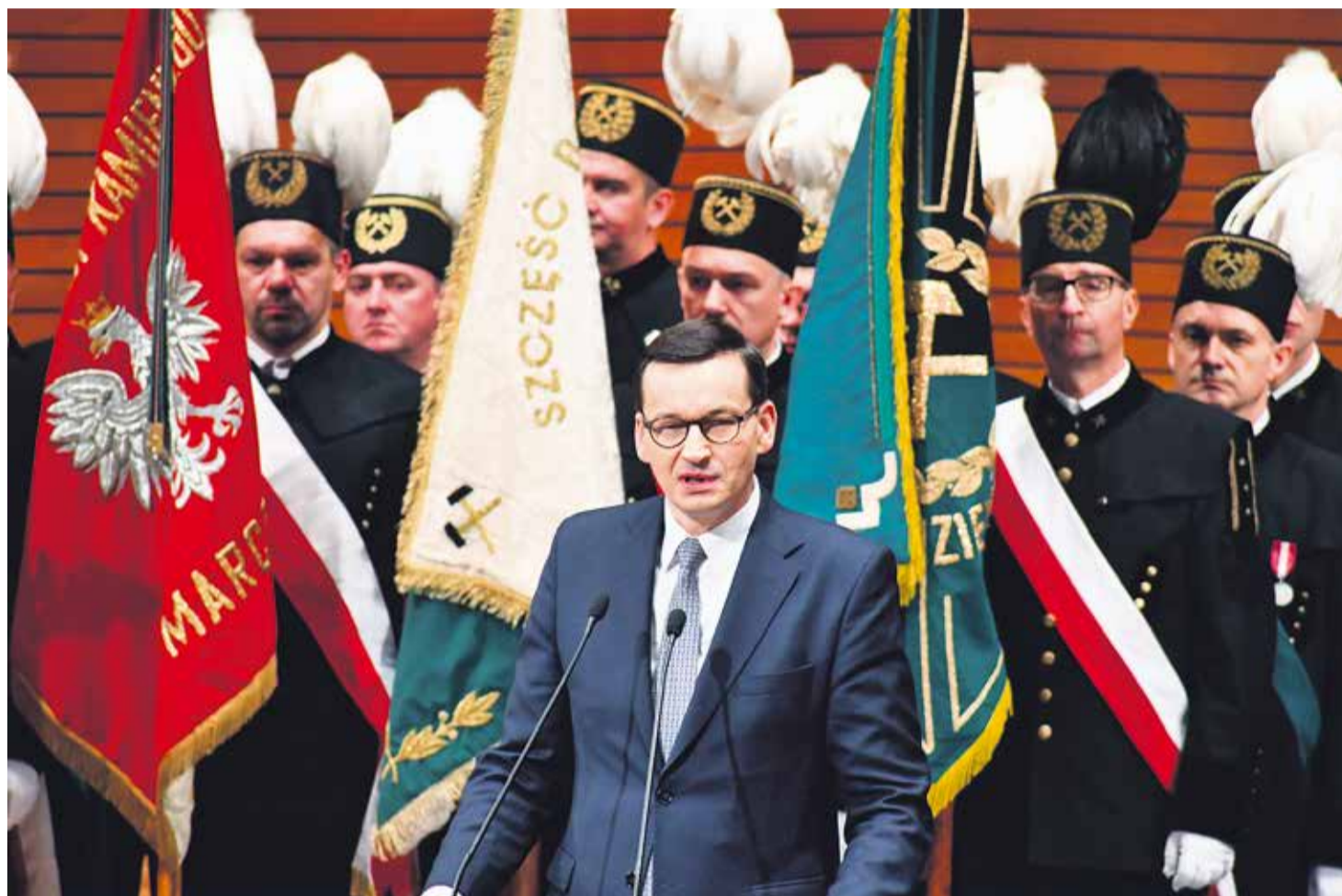
Premier Mateusz Morawiecki zapewnia, że polski rząd docenia znaczenie górnictwa dla gospodarki regionu i kraju