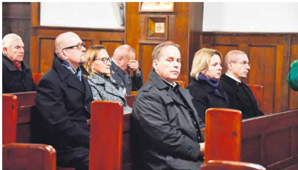
Modlitwa do św. Barbary o opiekę to tradycyjny element obchodów zakładowego święta