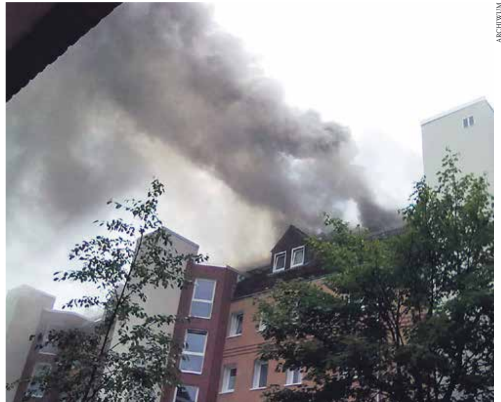
Co czwarty pożar wybuchł w mieszkaniu – tam, gdzie powinniśmy czuć się najbezpieczniej

Jeśli nie daj Boże znajdziemy się w mieszkaniu, w którym wybuchł pożar, nie możemy