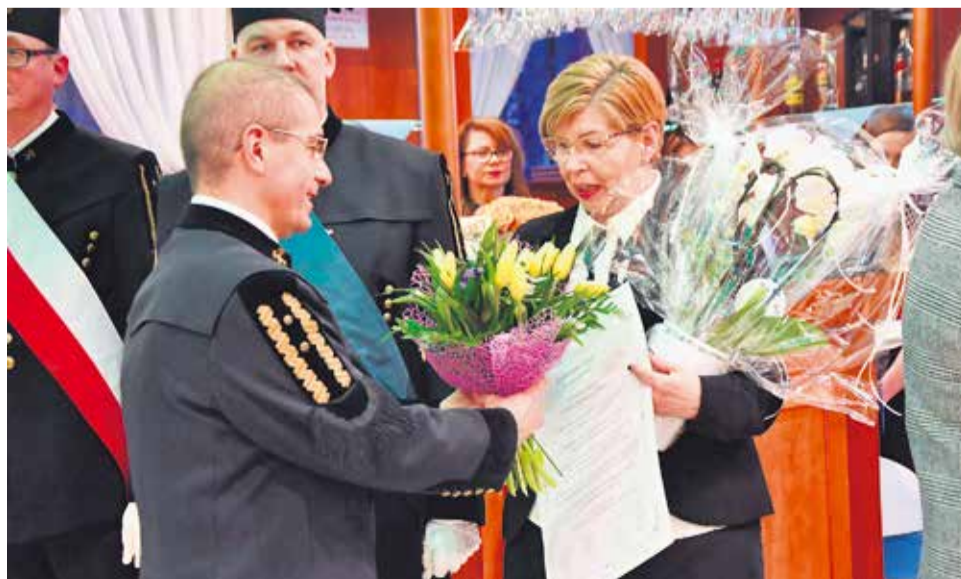
W każdej firmie pożegnanie odchodzących na emeryturę jest wzruszającym momentem