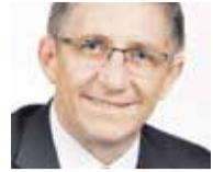
KOMENTUJE GRZEGORZ MATUSIAK

Przez pół wieku górnicy wydrążyli około tysiąca kilometrów wyrobisk korytarzowych i wydobyli 121 mln ton węgla. Te informacje robią wrażenie. Jednak ja pozostaję przy swoim zdaniu – najwyższy czas, aby ktoś opisał fenomen powstawania miasta dzięki kopalniom. Trzeba się śpieszyć. Ci, którzy to pamiętają, to już ostatni Mohikanie. //