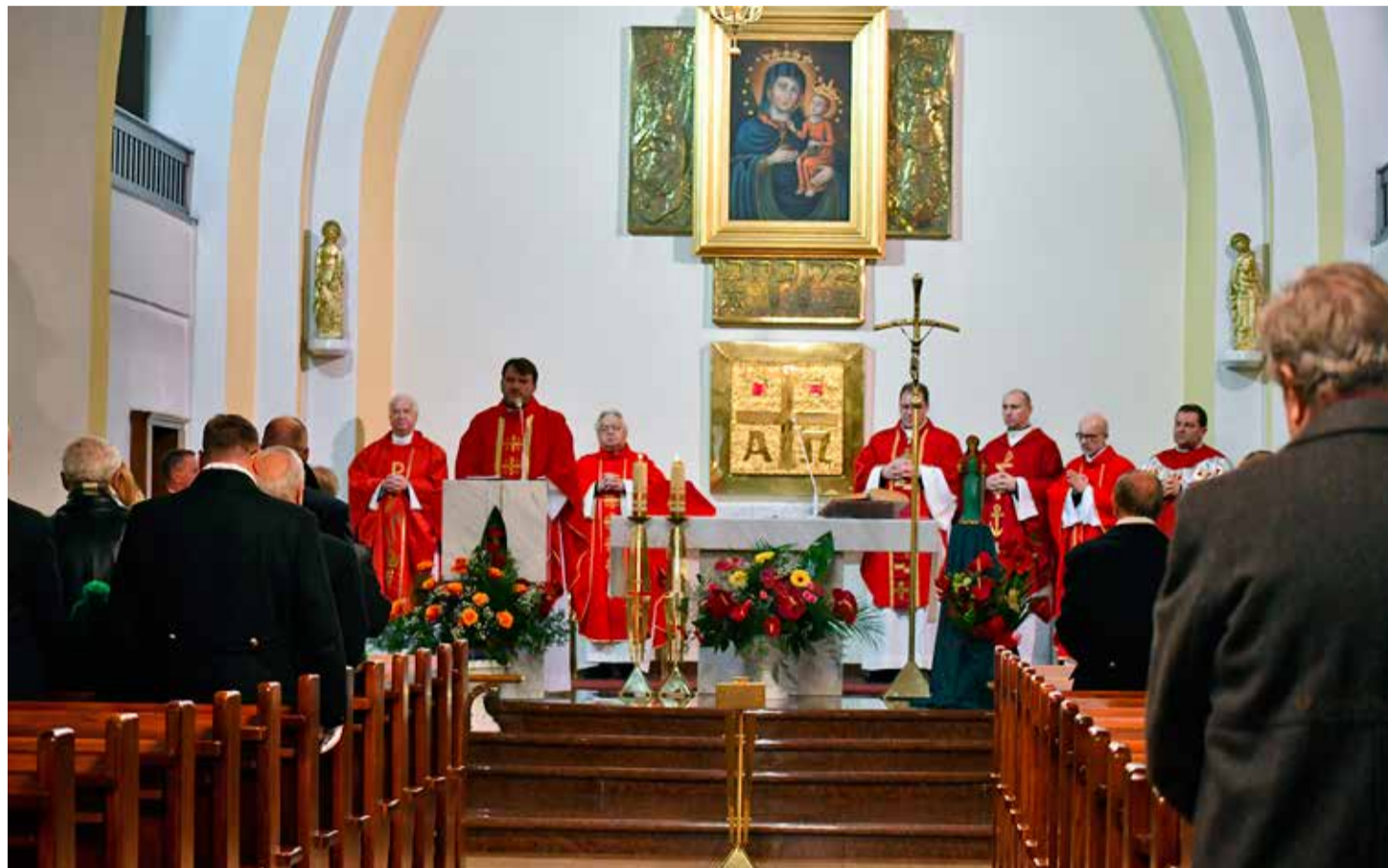
Pracownicy Grupy Kapitałowej FASING rozpoczęli obchody święta zakładowego od mszy świętej