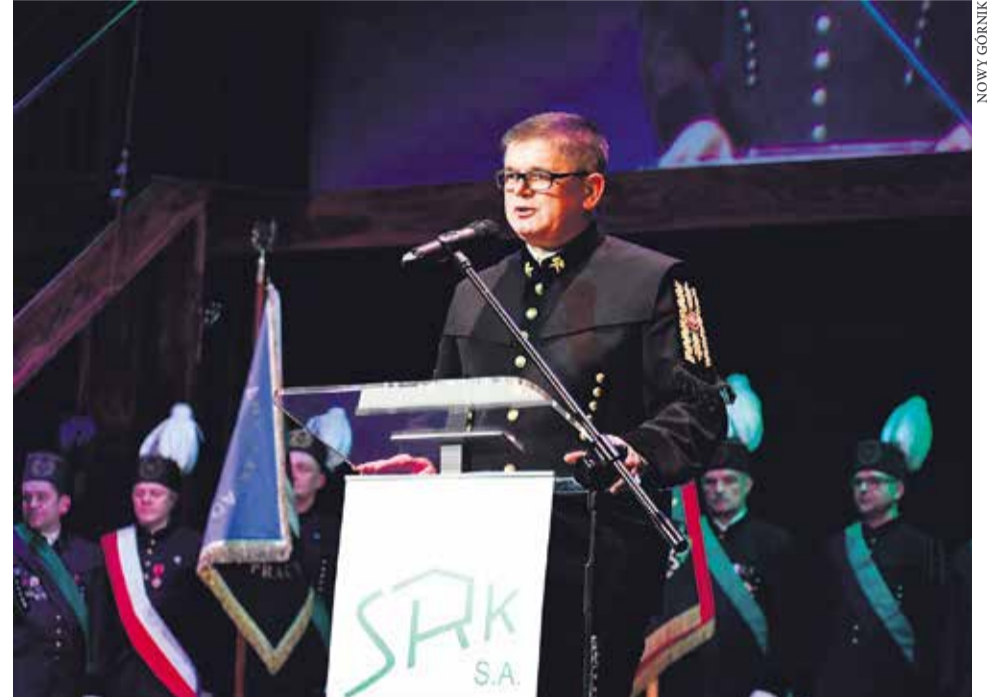
Adam Gawęda, wiceminister aktywów państwowych: – Dziękuję pracownikom SRK za górniczy trud