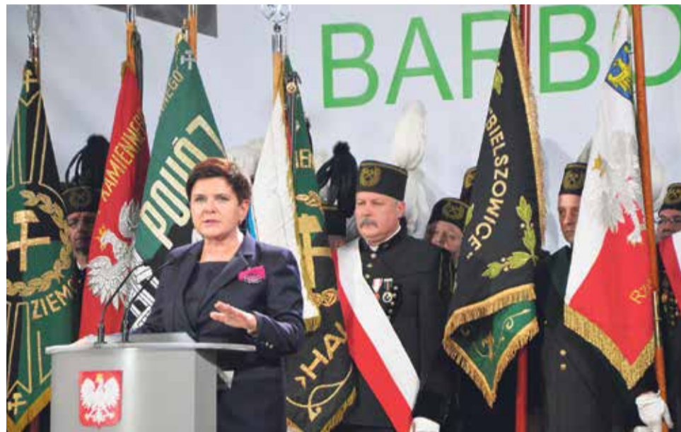
Reformy górnictwa były przygotowane i prowadzone w przekonaniu, że górnictwo i węgiel kamienny jest potrzebny nie tylko na Śląsku, ale całej polskiej gospodarce