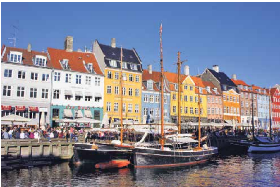
W jednej z kolorowych kamienic przy porcie Nyhavn mieszkał Hans Christian Andersen