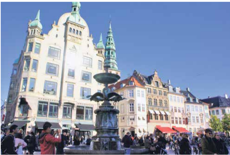
Kopenhaski deptak Strøget jest najdłuższą ulicą handlową w Europie