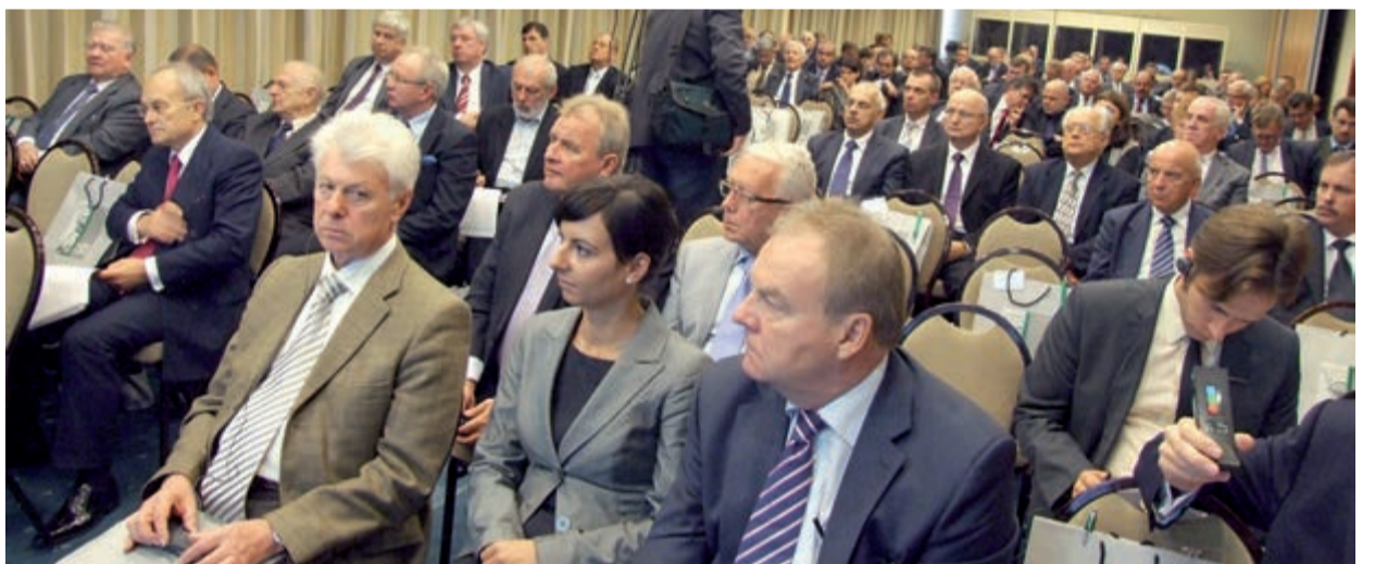
ST Forsowana polityka antywęglowa oznacza dla mieszkańców wielu państw drastyczny wzrost kosztów mediów energetycznych