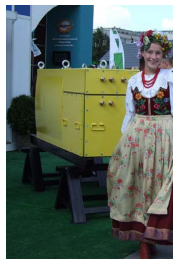
Wystawcy zapraszali do swoich stoisk. W tłoku maszyn i urządzeń