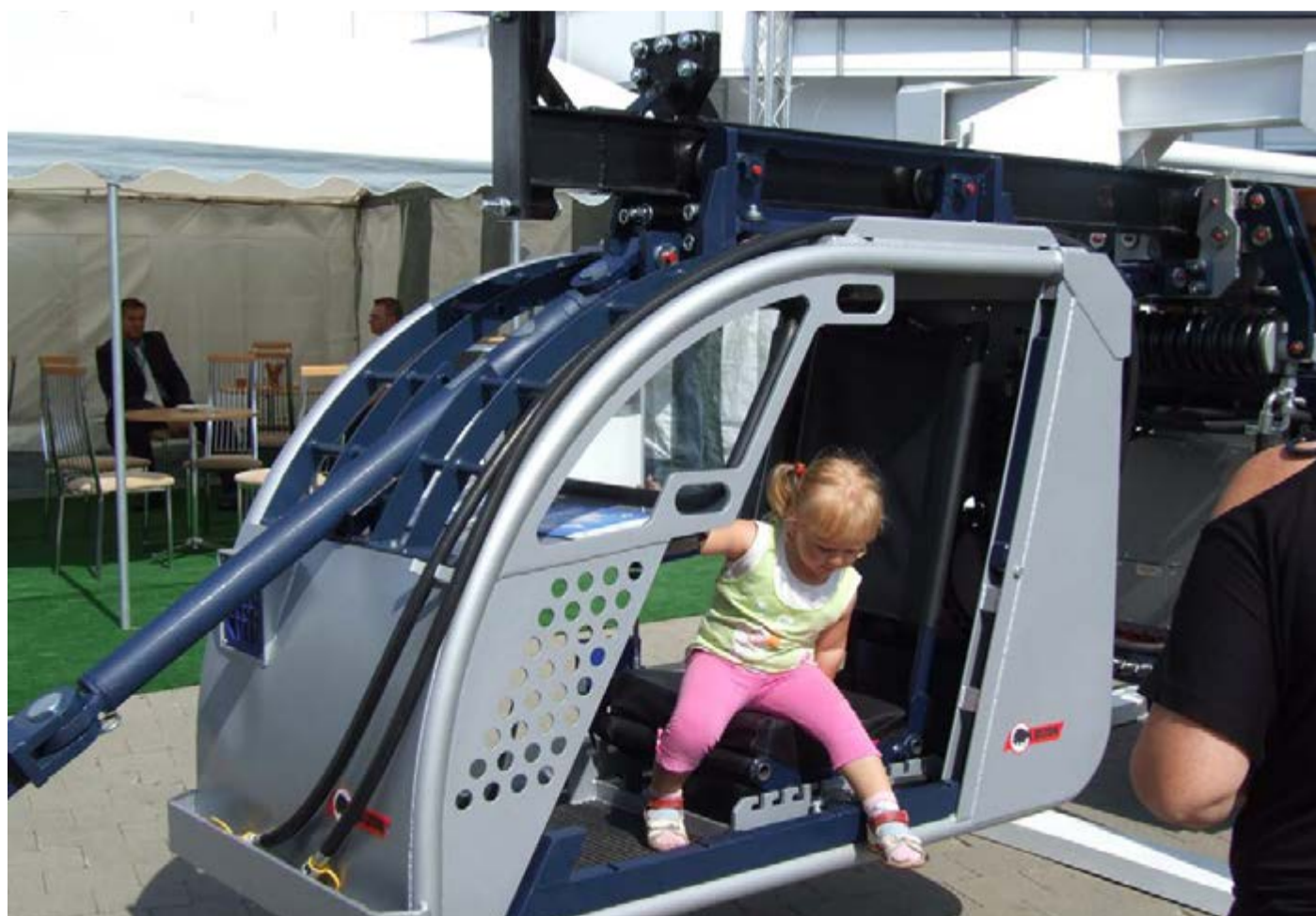
Na targach było znacznie ciekawiej niż na placu zabaw