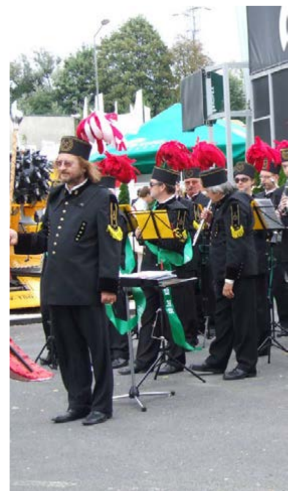
Kopex miał swój dzień na targach. Uświetnił go między innymi