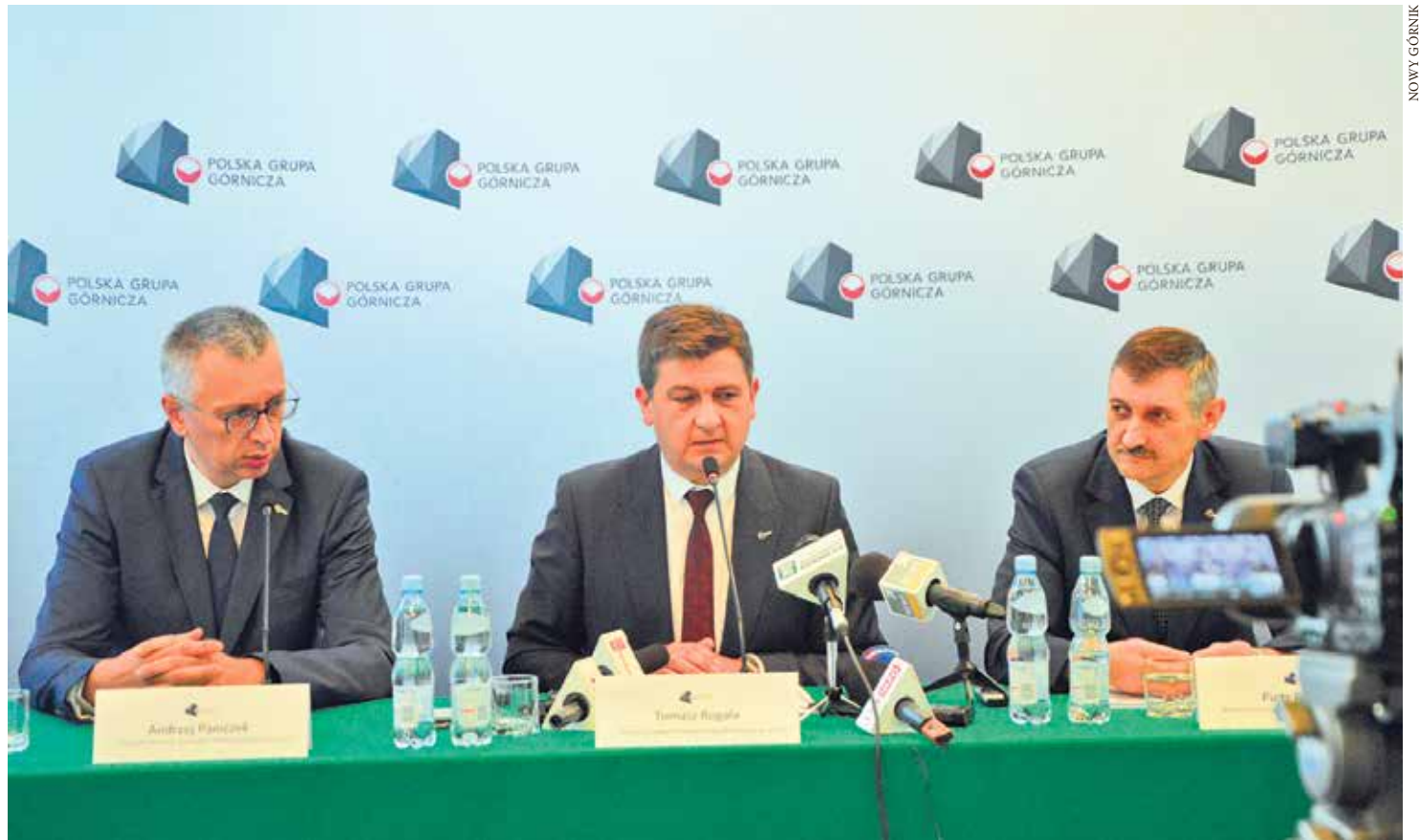
W tym roku spółka wyda na inwestycje 880 mln złotych. Do końca lipca zrealizowano i zawarto umowy

Program naprawczy w kopalniach tworzących od początku PGG trwa ponad rok. Kopalnie KHW zostały włączone do PGG 1 kwietnia tego roku. W nich dopiero rozpoczęto realizację programu naprawczego.