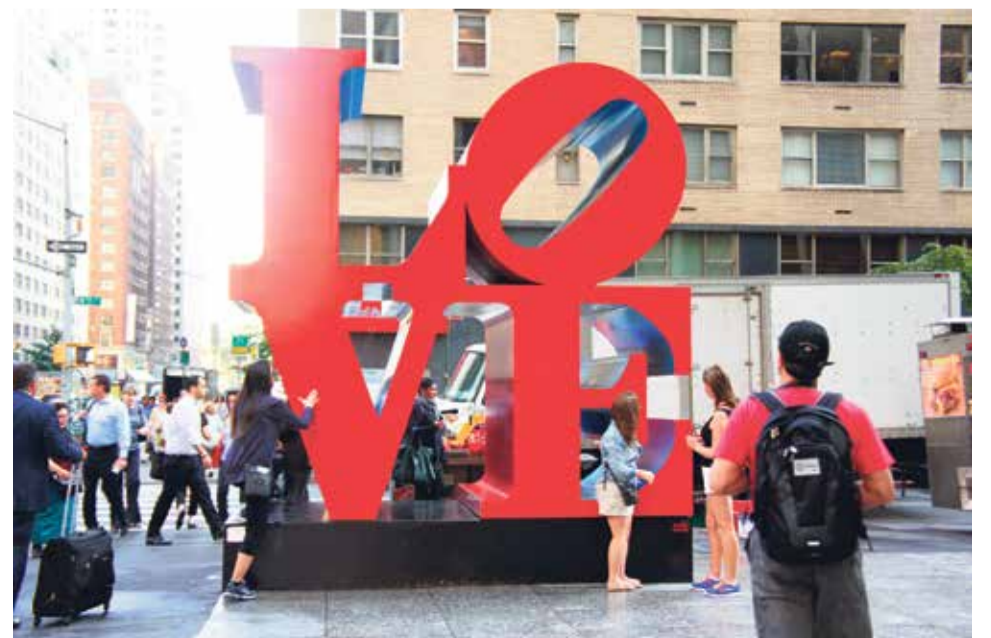
Charakterystyczna rzeźba Love z ustawioną pod kątem literą O jest znanym symbolem popkultury