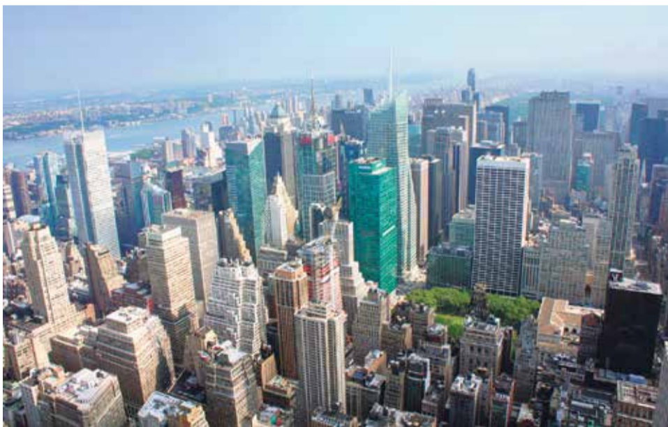
Najlepszy widok na miasto rozciąga się z położonego na 86. piętrze Empire State Building tarasu widokowego