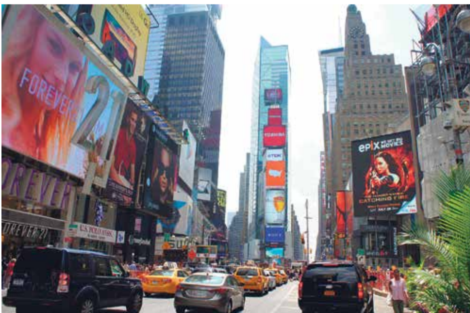
Times Square to jedna z najczęściej odwiedzanych atrakcji turystycznych na świecie