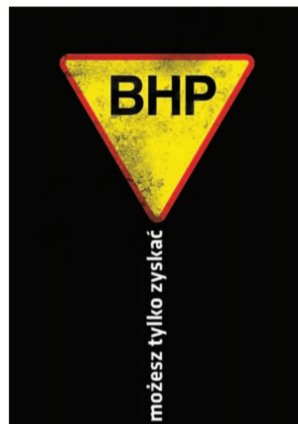
III miejsce – Kazimierz Strojcki