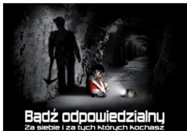
I miejsce – Paweł Pośpiech