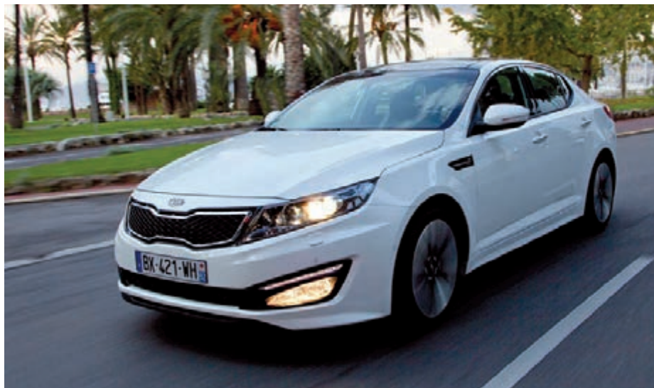
Nowa Kia Optima ma długość 4,85 m, szerokość 1,83 m, wysokość 1,45 m i rozstaw osi 2,79 m

Podczas pierwszych jazd testowych samochód wypadł bardzo dobrze. Równie pozytywne wrażenie co zgrabna sylwetka robi wnętrze auta. Nie jest to klasa Premium, ale jakość materiałów i poziom wykończenia są na całym przyzwoitym poziomie. Z kolei zawieszenie udanie łączy komfort resorowania z precyzją prowadzenia. Turbodiesel nie zapewnia sportowych osiągnięć, ale nie pozostawia niedosytu. To po prostu całkiem przyzwoity samochód.