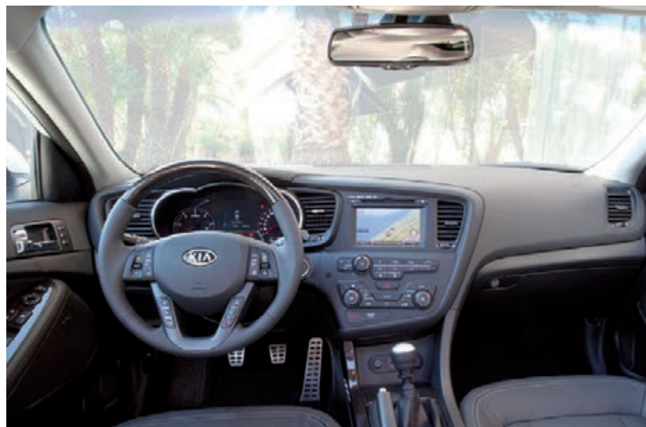
Jakość materiałów i wykończenie są na całym przyzwoitym poziomie w nowej Kii Optimie